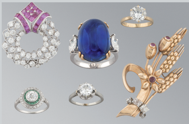
Bel écrin de bijoux dont bague saphir cabochon du Sri Lanka de 17 carats non chauffé, pb 10,01g. Avec son certificat.